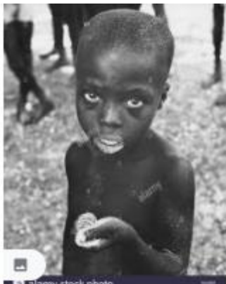
Niño de piel morena