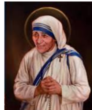
Teresa de Calcuta.