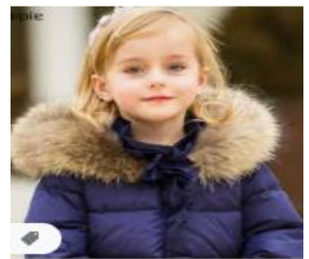
Niña de piel blanca

En compañía de tus padres dialoga sobre cada uno de estos personajes y responde en tu cuaderno las siguientes preguntas.