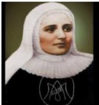
Laura Montoya Upegui